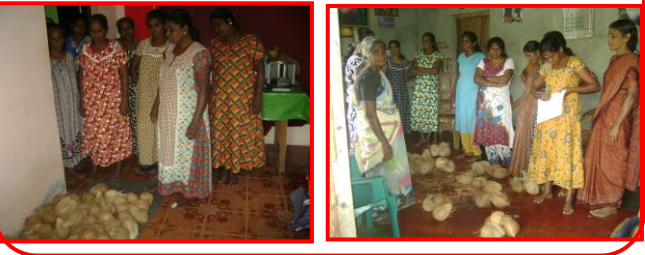
உற்பத்திப் பொருட்களை குழுக்களுக்கிடையே விற்பனை செய்தல்.