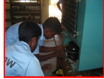
குளிரூட்டி திருத்துனர் பயிற்சி

பயிற்சி பெற்ற பயிலுனர்களுக்கான தொழில் உபகரணங்களும், சான்றிதழும் வழங்குதல்.